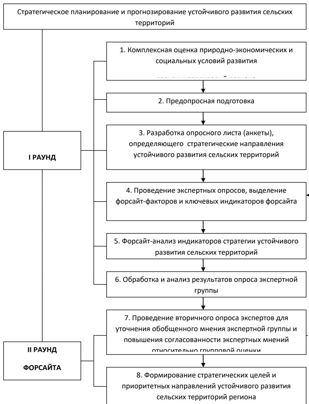
Рис. Алгоритм стратегического планирования и прогнозирования устойчивого развития сельских территорий на основе форсайт-технологий

После проведения опросов экспертов и анализа результатов количественного исследования была создана «зона консенсуса» относительно перспектив устойчивого развития сельских территорий Республики Башкортостан. В результате проведенного исследования сформирована методология проведения форсайта, в которой системный процесс «цель – задачи – состояние – альтернативные сценарии – стратегия устойчивого развития – исполнение» реализован по принципам подбора используемых специальных методов исследований и формирования экспертных фокус-групп.